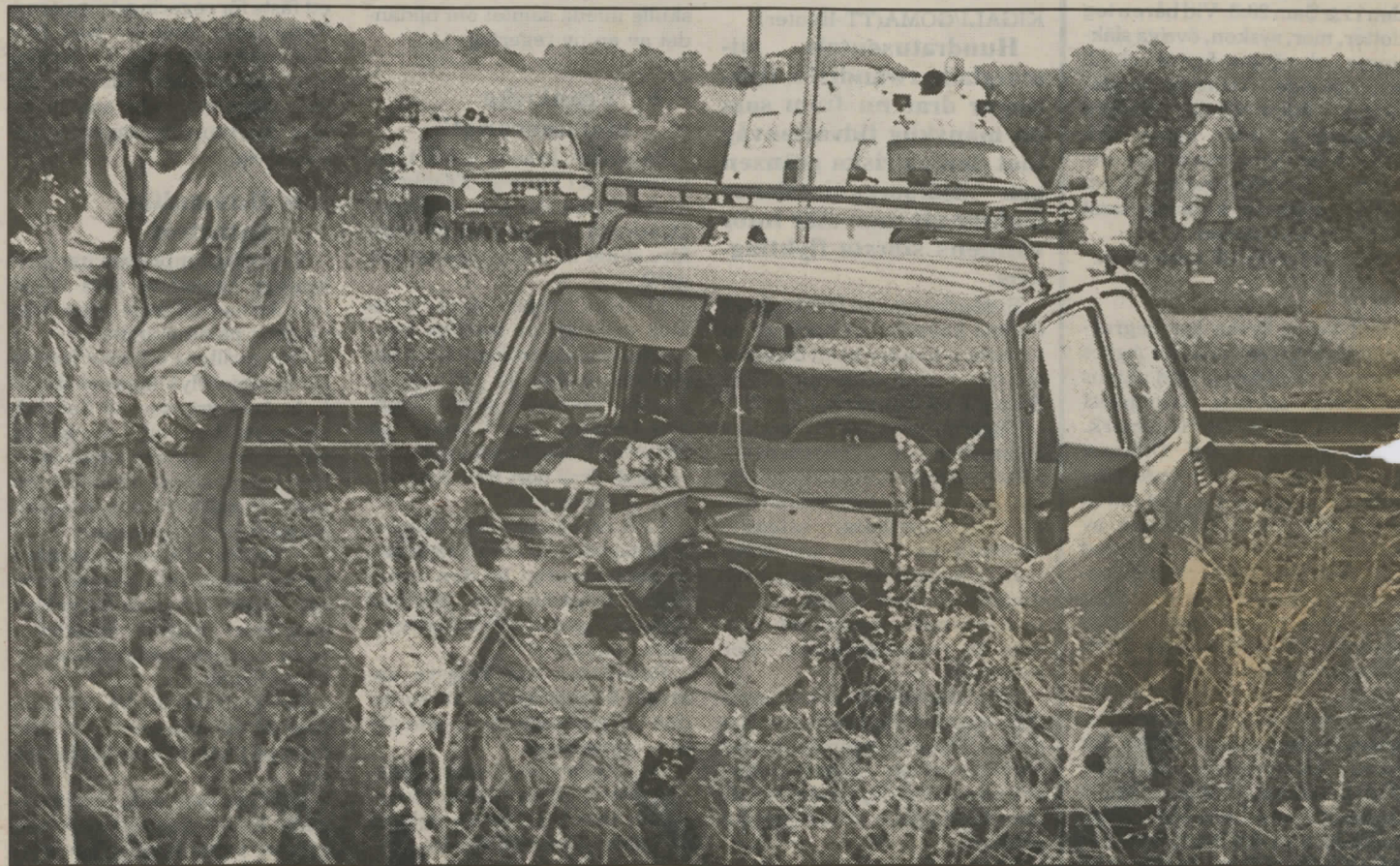
Den lilla bilen totalkvaddades vid krocken med tåget. Föraren hade änglavakt, bortsett från skrapsår på benen var han oskadd. (Foto: Marita Wass).

– Bilisten hade en otrolig tur. Som bilen såg ut förväntade