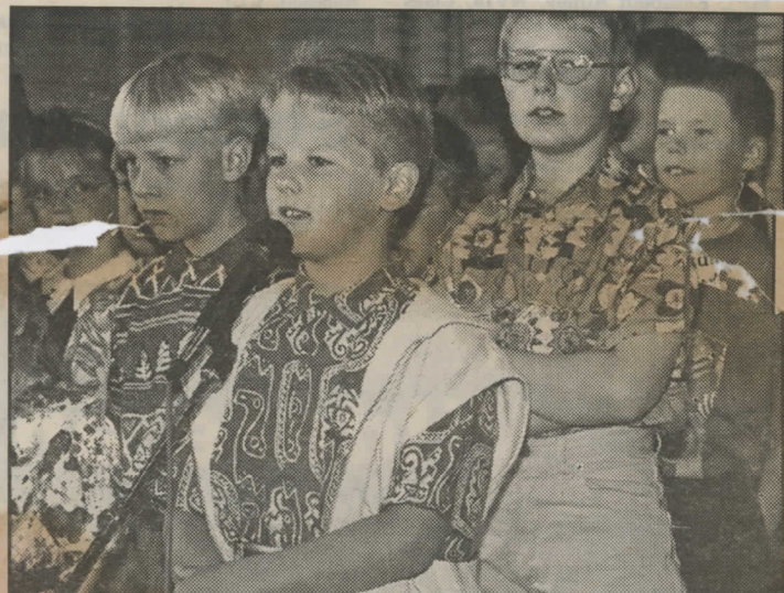
Lågstadiebarnen bjöd på sång, musik och dikter när Vartofta skola firade sin avslutning.