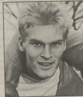
"Nicke" minns Dahlins 2-1-mål.