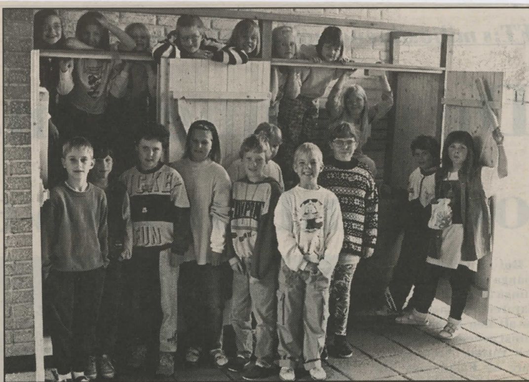
Klass 2 i Vartofta skola vid den sopsorteringsanläggning skolans elever själva tagit initiativet till och som nu engagerar all personal – från lärare via vaktmästare till matbepisningen.