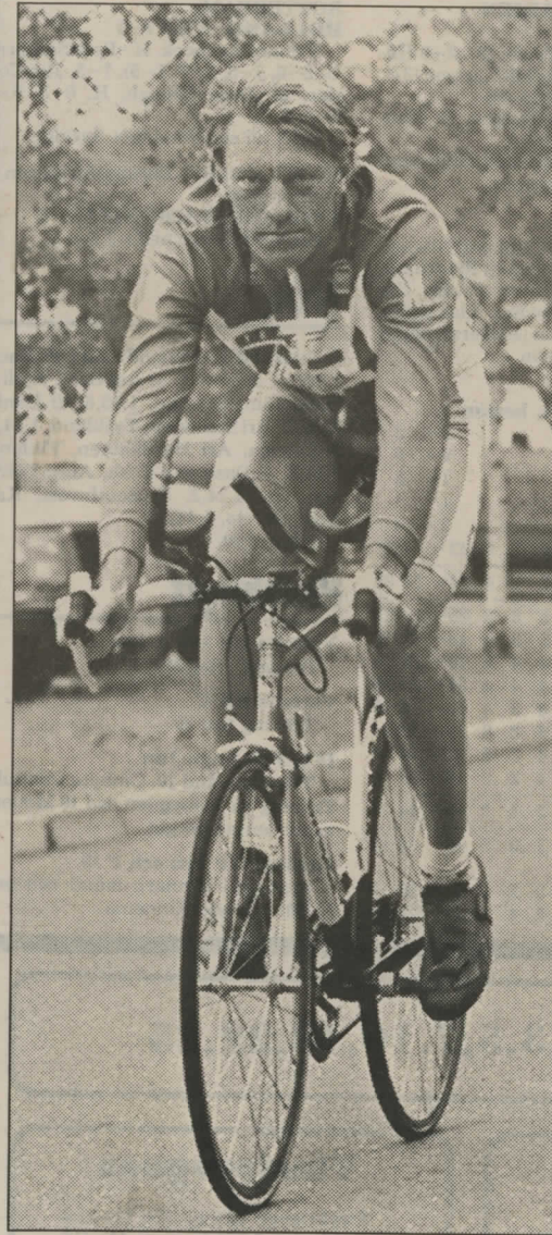
“Fysiskt kan man nå en viss nivå, men hjärnan säger ifrån tidigare än kroppen”.

– Visst har det gått bra, men det kan gå ännu bättre. Jag har som sagt ändrat träningen