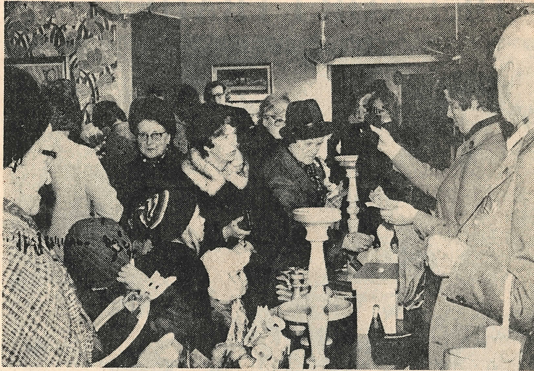
Det var trångt kring borden vid Elvagårdens försäljning – men så fanns också möjlighet att göra fina julklappsfynd.

5.300 kronor blev resultatet av den försäljning som pensionärerna på Elvagården hade på sina terapiarbeten. Ett fint resultat alltså och ett bra tillskott till den kassa som