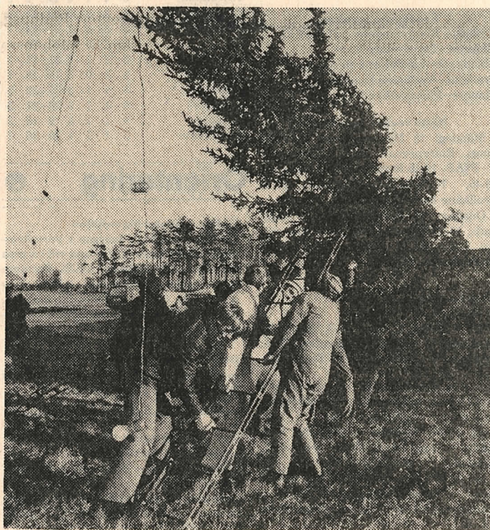
Med förenade krafter kom granen på plats.