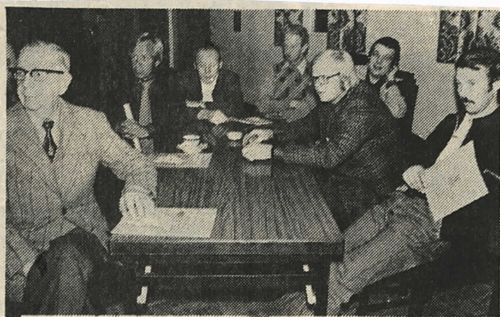
På bilden ses några av de intresserade deltagarna i träffen Vartofta.