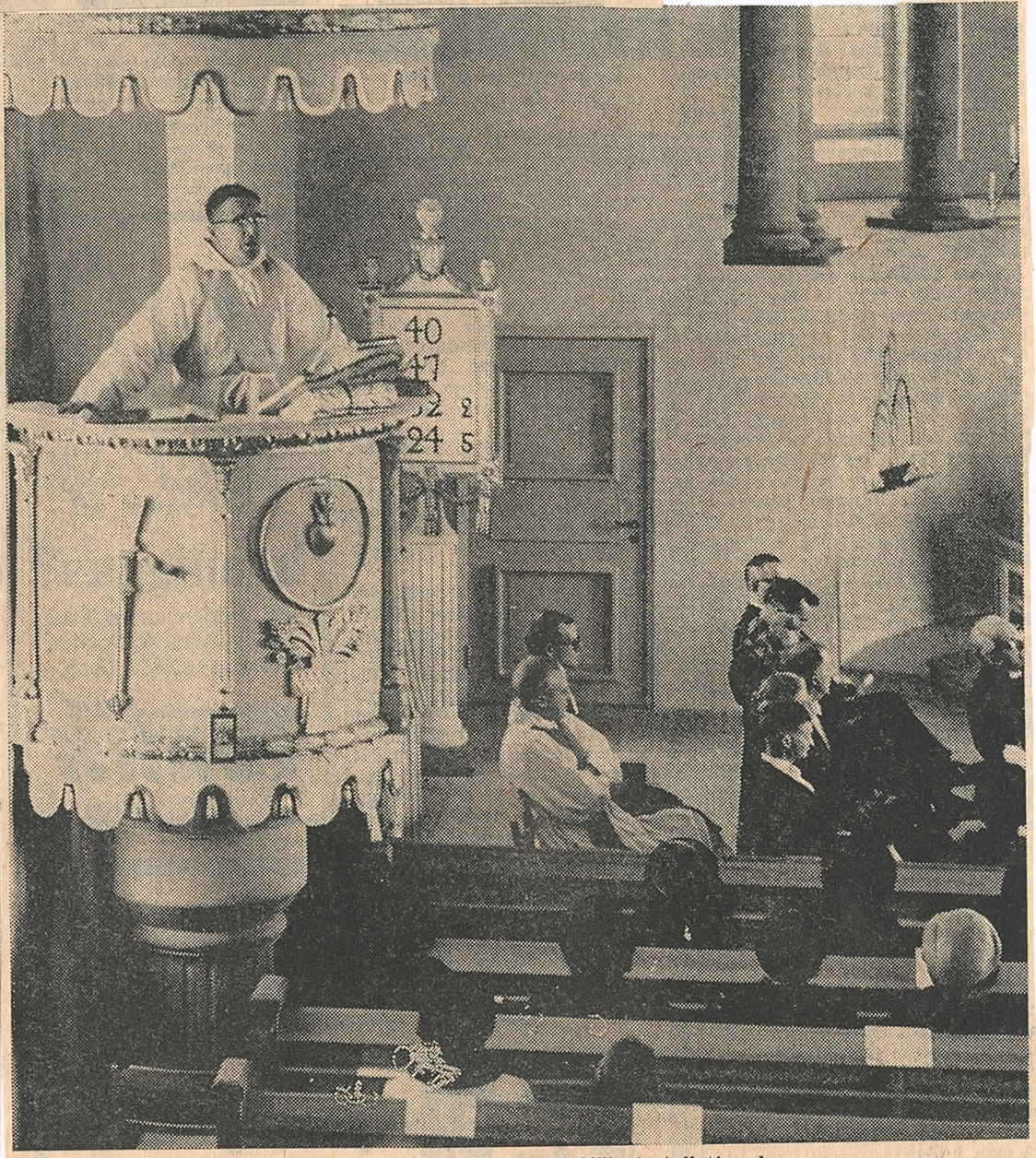
Nye kyrkoherden i predikstolen i Slöta installationsdagen.