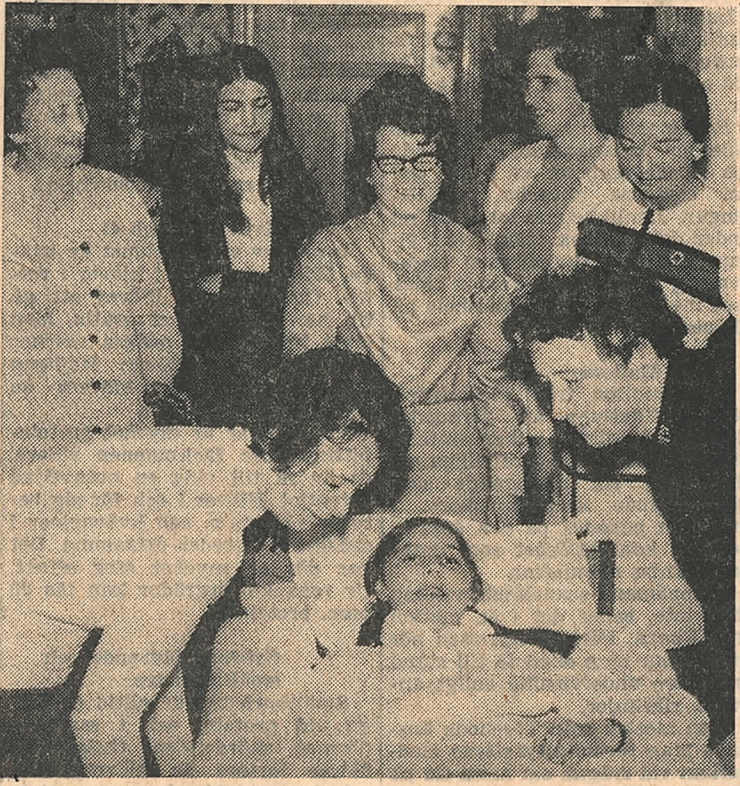
Sjukvårdskursen för hemsamariter avslutades på årsmötet.

Årsmöte med Vartoftaortens Röda Korsrets hölls i fredags på Vartofta gård med relativt gott deltagande.