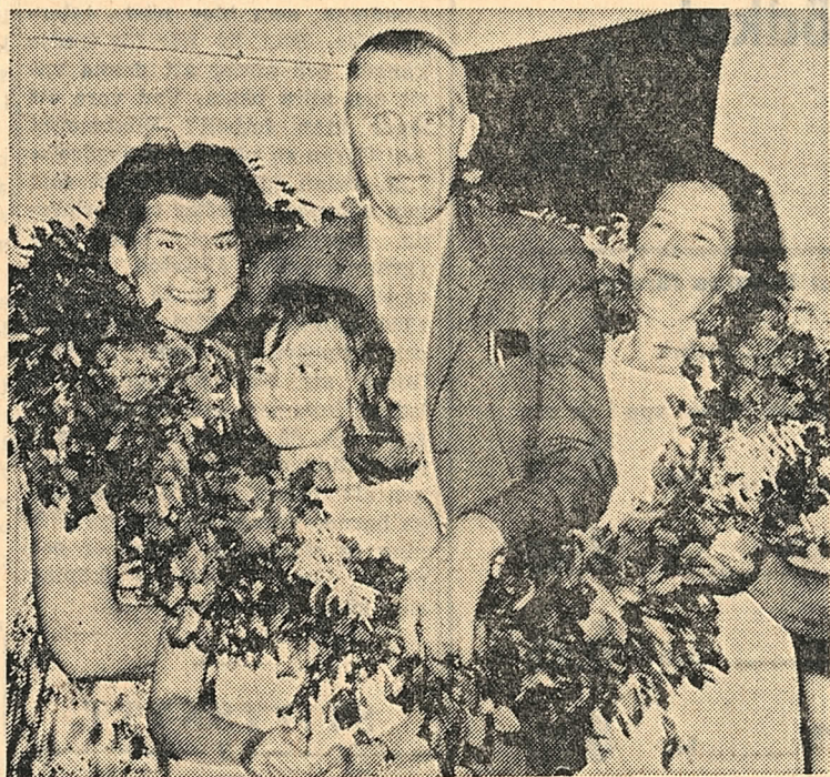
Glada deltagare i Slöta Centerkommittés familjerally. 4/7-63.