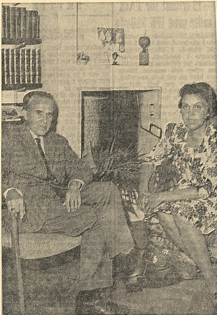
Hemma igen i Slöta.

Om allt detta i och för sig är främmande för svenska lutheraner så är grundstämningen i församlingen varm och välkomnande, genomträngd av gemenskap. Inte minst står ämbetets utövare genast mitt i en krets av människor och är inte ett ögonblick utanförstående — även om han är en främmande person av annan stam, annat tungomål och annan ritual. Han är omsluten av församlingen och företräder en